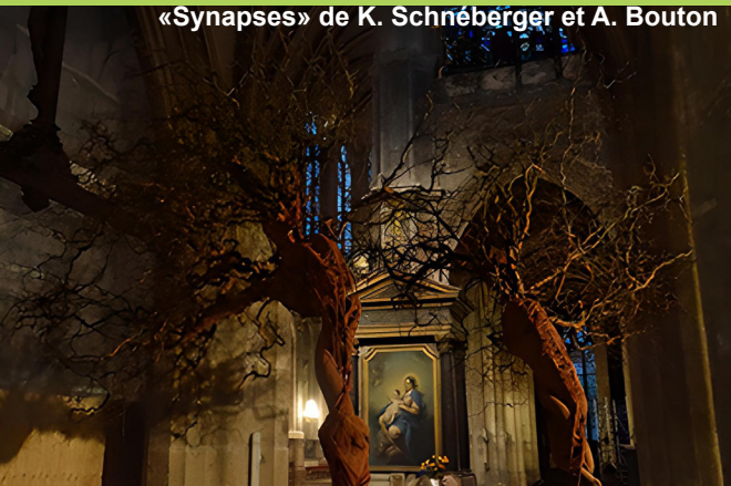
«Synapses» de K. Schnéberger et A. Bouton