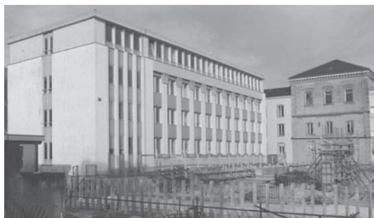
Institut Chantemerle 20

Et voilà que la caravane reprend la route, direction le Mail. Simple mais fonctionnel, bien situé avec, côté sud, sa vue sur le parc agrémenté de séquoias géants, puis sur le lac, ce bâtiment allait regrouper un bon nombre d'activités de la Faculté des sciences.