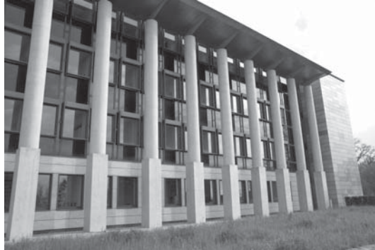
L'Institut dans la Rue Emile-Argand